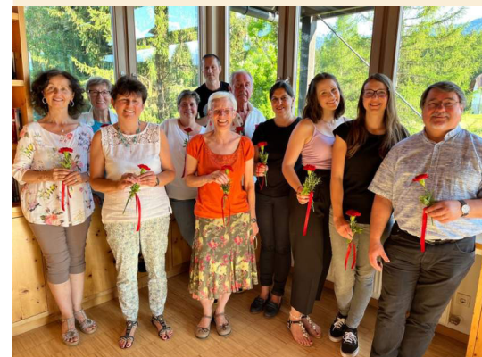
Am 14. 6. 2022 wurde der Vorstand des Slowenischen Kulturvereines neu bestellt.