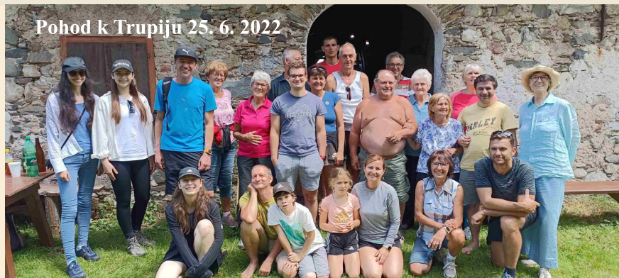
Pohod k Trupiju 25. 6. 2022