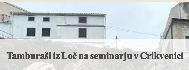
Tamburaši iz Loč na seminarju v Crikvenici