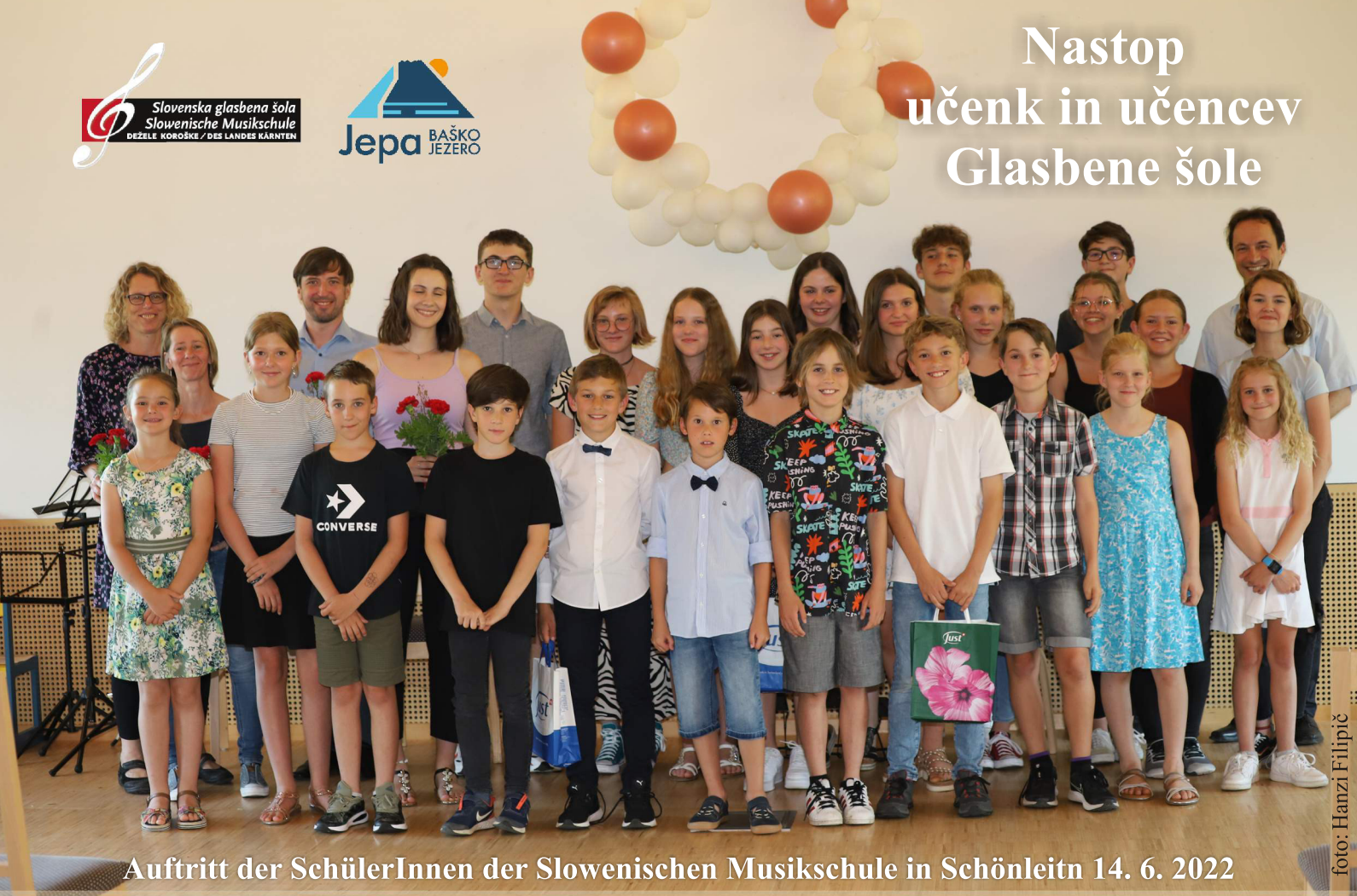
Auftritt der SchülerInnen der Slowenischen Musikschule in Schönleitzn 14. 6. 2022