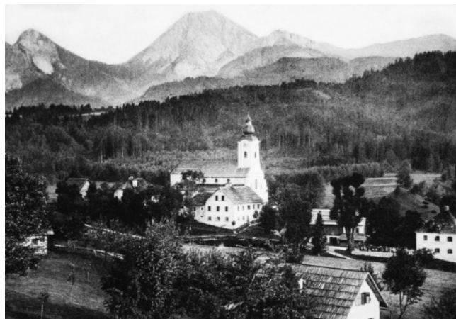
Vas Loče na Koroškem leta 1906.