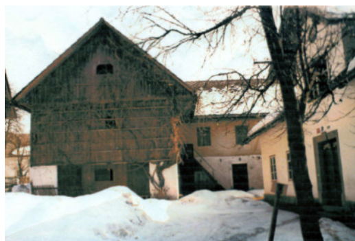
Kmetija pr' Novak, Selo 22.