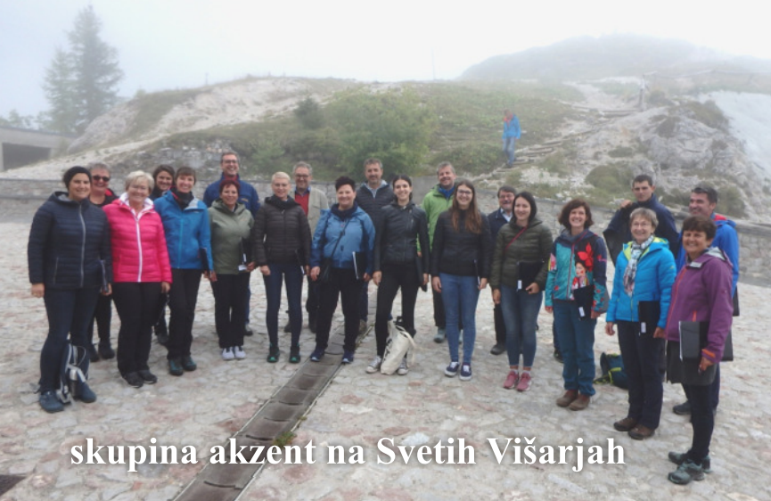
skupina akzent na Svetih Višarjah