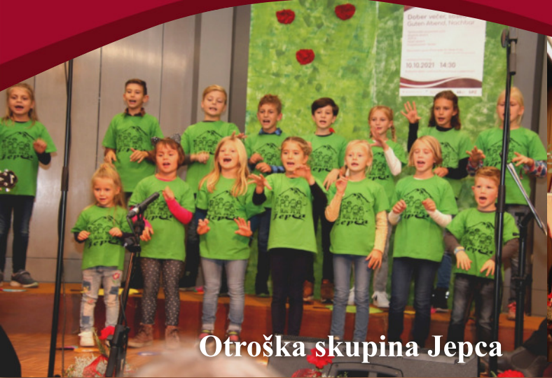
Otroška skupina Jepca