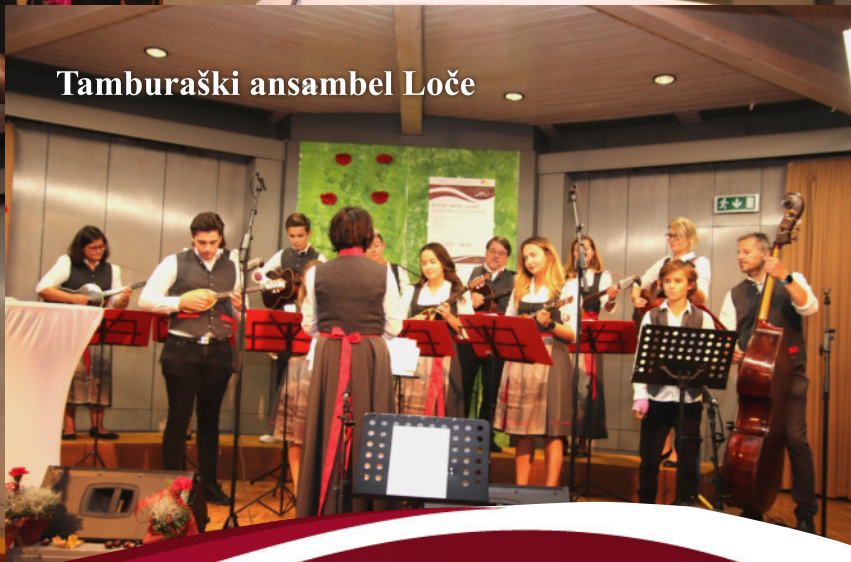
Tamburaški ansambel Loče